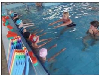
Idén is lubickoltunk...! 5. oldal