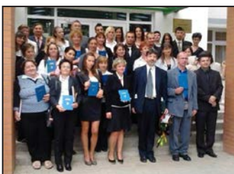
Búcsúznak a „báthorisk” 4. oldal