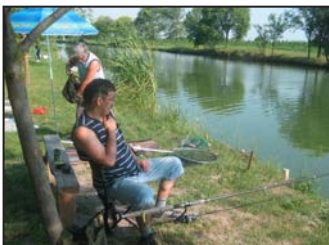
Teknősbéka is akadt a horogra – 4. oldal