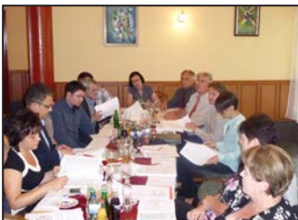
Képviselő-testületi ülés 2. oldal