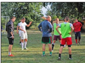
Az Ebes KKSE júliusi hírei 7. oldal